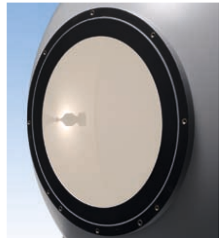
300 mm Messöffnung

An der 300 mm Messöffnung befindet sich ein universeller Montageflansch mit Gewindeeinsätzen, um die Befestigung der verschiedenen Prüflinge zu erleichtern. Darüber hinaus sind verschiedene Adapterplatten erhältlich, wie beispielsweise für den LED-850 High-Power LED-Testadapter mit TEC-Temperaturkontrolle. Diese Adapterplatte verfügt über eine solide mechanische Auflage mit Einspannbacken, um eine zuverlässige Positionierung des LED-850 Testadapters zu gewährleisten.