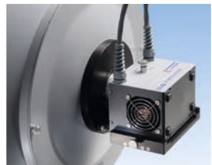
Adapterplatte mit LED-850