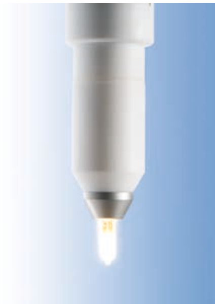
50 W Halogenlampe an Lampenhalter

Für die spektrale und absolute Kalibrierung der ISP 1000 ist der interne Lampenhalter mit dem Adapter für Halogenlampen erforderlich. Für kundeneigene Re-Kalibrierungen stellt Instrument Systems eine 50 W Kalibrierlampe sowie eine hochstabile Stromquelle zur Verfügung. Dadurch werden Kalibrierungen vor Ort ermöglicht, ohne dass die Kugel transportiert werden muss.