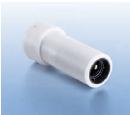
Adapter für E27 Fassung

Für die traditionelle Messung des Gesamtlichtstromes von Lampen in 4 \pi -Anordnung steht der universell einsetzbare Lampenhalter zur Verfügung. Er besteht aus einem Grundkörper mit ansteckbaren Adaptern für die verschiedenen LED- und Lampentypen, wie z. B. radial bedrahtete LEDs des Typs T 1 \frac{1}{4} sowie Halogenlampen des Typs G4/GX5.3/G6.35 und Lampen mit E27 bzw. E14 Fassung. Auf diese Weise kann die Kugel schnell und kostengünstig umgerüstet werden. Der Lampenhalter kann zudem in stehender und hängender Position montiert werden, um die jeweiligen Vorgaben für die Brennlage der Lampe zu erfüllen.