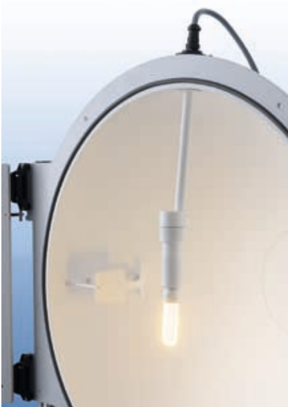
ISP 1000 geöffnet mit Lampenhalter in hängender Position

Der interne Proben-tisch eignet sich insbesondere für die präzise Vermessung von großen LED-Modulen. Die 200 x 200 mm große Plattform des Proben-tisches ist höhenverstellbar und erlaubt dadurch die exakte Positionierung des Prüflings im Zentrum der Kugel. Dabei ermöglichen die M5 Gewinde im Raster von 50 mm dessen stabile Befestigung in der gewünschten Lage. Die Bestromung und Ansteuerung des Prüflings erfolgt bequem über eine 16-polige Anschlussleiste.